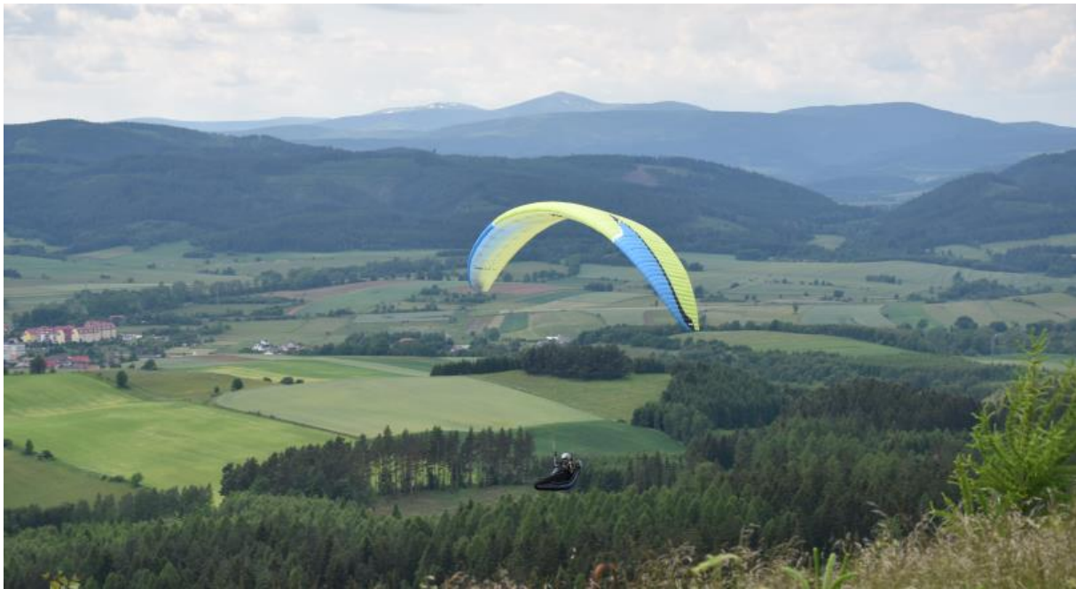
Widok z Rogu

Z Rogu są różne warianty powrotu w zależności od pogody, kondycji i ochoty uczestników. Poniżej przedstawiam wariant najdłuższy – całość około 8 km przez kaplicę św. Anny i Dwunastu Apostołów