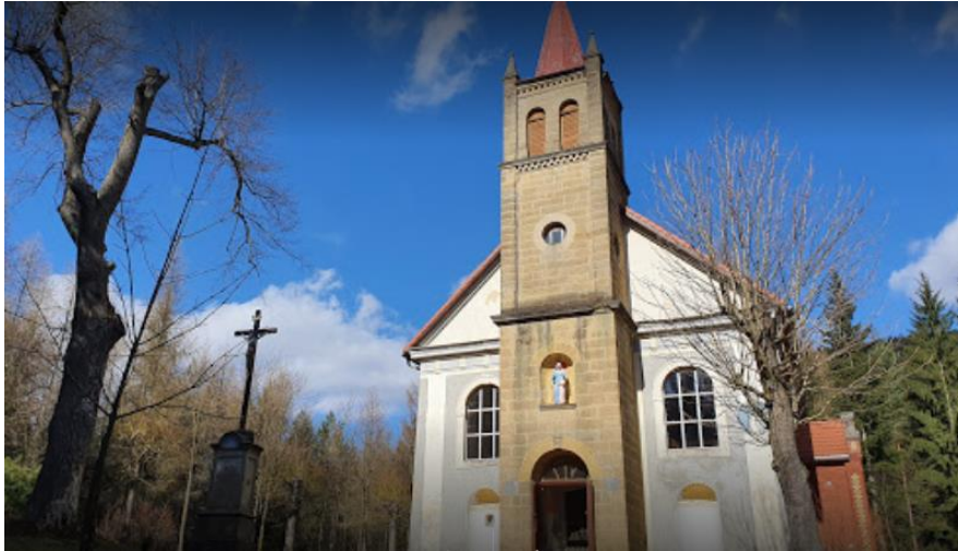
Kaplica Św. Anny